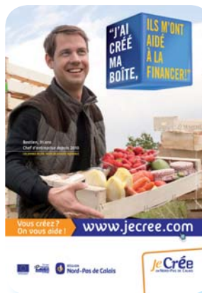
L'un des 6 visuels de la campagne d'affichage Je crée ne Nord Pas de Calais 2011

Sur la période de janvier à septembre 2011, la région a enregistré 17.922 nouvelles entreprises, soit une diminution de 12% au regard des neuf premiers mois de 2010. Cependant, la création d'entreprises dans la région reste à un niveau élevé en 2011, tout comme dans l'ensemble des régions de France. En effet, le nombre de créations enregistré durant ces neuf premiers mois est supérieur à celui observé de janvier à septembre 2009 (+3%).