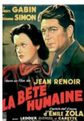
La Bête Humaine (Jean Renoir)